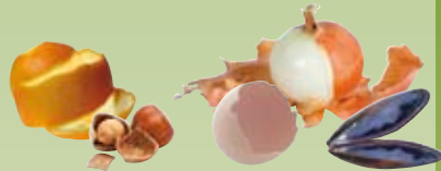
Epluchures et coquilles