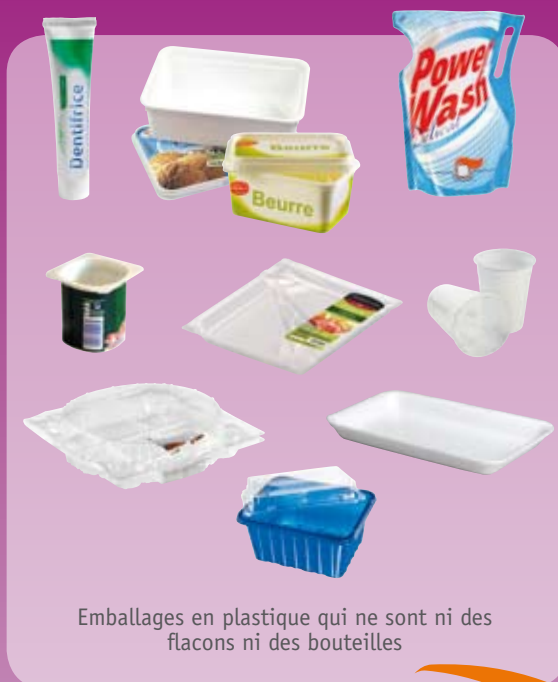
Emballages en plastique qui ne sont ni des flacons ni des bouteilles

Les déchets résiduels ne pouvant pas faire l'objet d'une collecte sélective