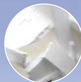
Frigolite de calage