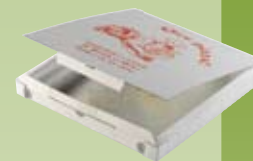
Cartons alimentaires souillés