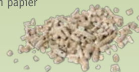
Litières biodégradables, cendres froides de bois non traité