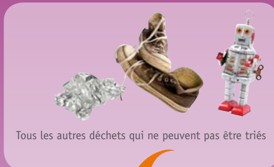
Tous les autres déchets qui ne peuvent pas être triés