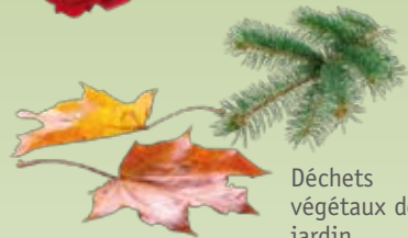
Déchets végétaux de jardin