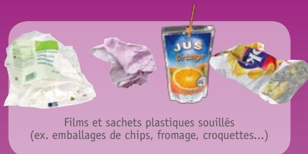
Films et sachets plastiques souillés (ex. emballages de chips, fromage, croquettes...)