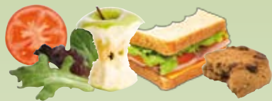
Restes de repas et aliments périmés