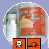
Déchets spéciaux des ménages

Seringues acceptées au parc à conteneurs, dans un flacon ou plastique dur et fermé.