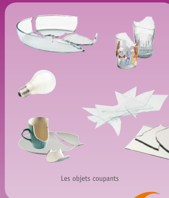
Les objets coupants