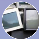
Déchets d'équipements électriques et électroniques