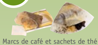
Marcs de café et sachets de thé