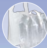
Films et sachets plastiques propres, non souillés