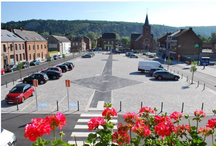
Rénovation de la place d'Anhée dans le cadre du 1 er PCDR