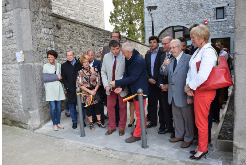
Inauguration de la Maison de la Ruralité à Bioul, dans le cadre du 1 er PCDR